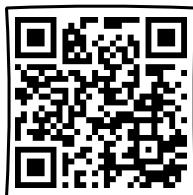
Video 4: Mit Liebe und Fett beschöpfen