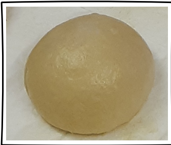
Die perfekte Kugel :)