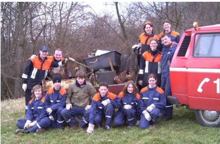
Die ersten Jahre sammelten wir bei der Müllsammelaktion jeweils einen Autoanhänger voll Unrat zusammen.

Seit 2003 beteiligen wir uns im Frühling an der Säuberungsaktion des Abfallwirtschaftsverbandes zur Reinigung unserer Umwelt. Hier sehen die Jugendlichen, was alles sinnlos in die Natur geworfen wird. Dabei leisten sie einen wichtigen Beitrag für unsere Umwelt und haben gleichzeitig Spaß sowie einen nachhaltigen Lerneffekt. Zur Stärkung von Körper und Team gibt es zum Abschluss immer eine kleine Brotzeit.